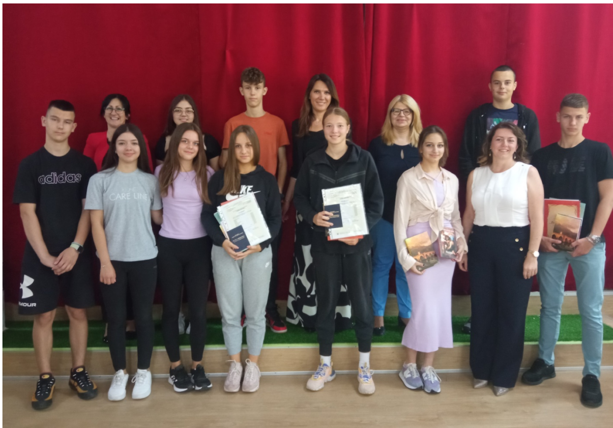
Вуковци са одедљењским старешинама